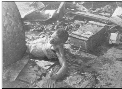
Figura 4. Heridos de la explosión del vapor La Coubre.