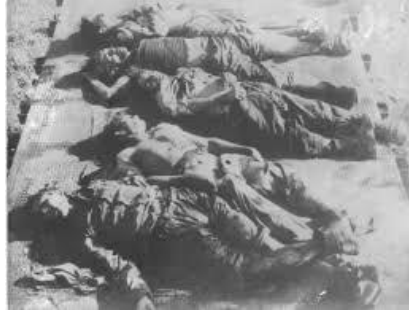
Figura 2. Golpe de estado de