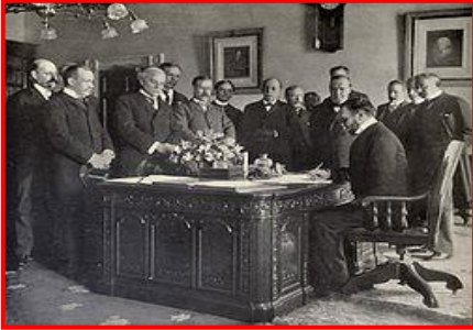
Figura 1. Firma del Tratado de París. Fulgencio Batista.