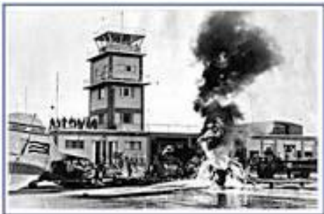
Figura 5. Bombardeo al aeropuerto García Ciudad Libertad.