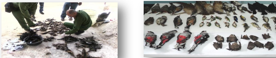
Figura 2 Muestra de hechos delictivos detectados por el Cuerpo de Guardabosque en marzo 2017.

Esta escasez e inaplicabilidad de normativas jurídicas en materia de fauna y flora silvestre y caza (fauna cinegética) tanto regulatoria como sancionadoras anteriormente comentada, hoy se ha unido agravándose cada vez más a la indisciplina social generando según estadías e investigaciones del Cuerpo de Guardabosques y la Facultad de Biología de la Universidad de la Habana y otros, la captura y comercio ilegal de especies de la fauna silvestre, la caza furtiva y el comercio de las carnes objeto de esta caza, que ponen en peligro la preservación, conservación y desarrollo sostenible de la flora y fauna silvestre, lo cual se muestra en la Figura 2 a continuación: