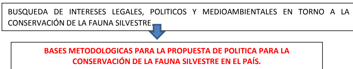
Figura 1: Esquema metodológico de la investigación.