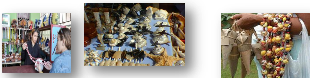
Figura 3 muestra la actividad de cuenta propia con recursos naturales de la fauna silvestre, tomado de datos del Cuerpo de Guardabosque marzo 2017, como parte de enfrentamiento a las actividades ilícitas en el territorio nacional.

Otro punto controvertido actualmente, que se le une a lo comentado anteriormente, ya que amenaza constantemente a la fauna silvestre es la creación de regulaciones legales para otras esferas que son permisibles para trabajar con los recursos de la fauna silvestre, en la actividad por cuenta propia, dándole una vía específica para él la amenaza y el derroche, de tal recurso al hombre en su actuar y sin existir una regulación concreta que permita que aunque puedas trabajar y adquirir estos recursos, hacerlo de manera legal, y sobre los criterios adecuados para la conservación y manejo de tales especies, ya que en la práctica solo se evidencia un documento, que ni tan siquiera es de rango legal del Centro de inspección ambiental, que contiene varias regulaciones para trabajar con estos recursos en la actividad por cuenta propia, lo cual se evidencia en la Figura 3 a continuación: